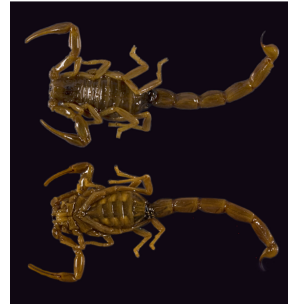
Buthus occitanus . Río Tizi (Marruecos). Colectado por Manuel Martínez de la Escalera. Colección de Invertebrados MNCN.

Además, en las colecciones del Museo se conservan miles de ejemplares colectados por los socios de la Española como así está escrito en las etiquetas originales. Destacan los procedentes de la Comisión para la exploración del Noroeste de