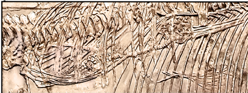
Fósil de ictiosaurio con su cría, en el MNCN. Fernando Arnáiz

“No debería resultarnos extraño que los niños consigan, con sus preguntas, muchas veces insólitas e inimaginables, dejar apabullados a la más avezada educadora o al más curtido de los guías voluntarios”