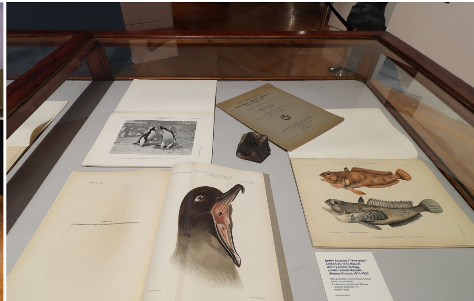
Vista general y detalle de la muestra que se podrá visitar en el Museo hasta octubre de 2022. / José María Cazcarra