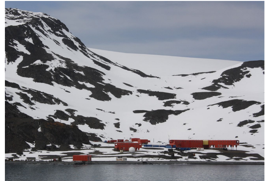
La base antártica Juan Carlos I que esta gestionada por el CSIC

“La mención de la Antártida evoca las grandes gestas de la exploración a la búsqueda de tierras desconocidas en las que la tragedia y el éxito iban de la mano”