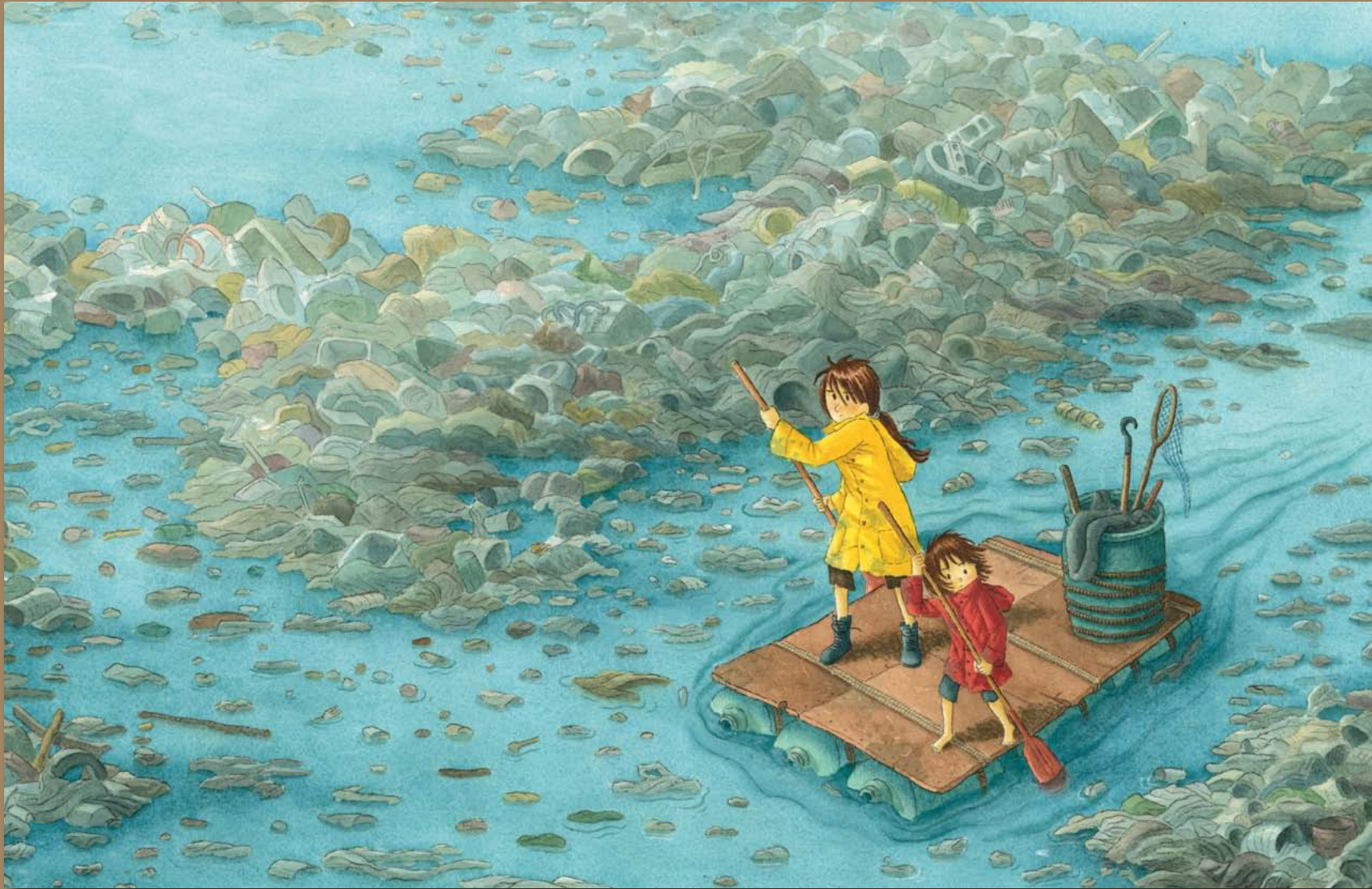
Ilustraciones Xavier Salomó