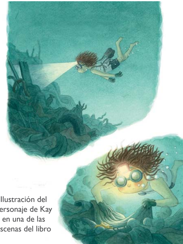
Ilustración del personaje de Kay en una de las escenas del libro