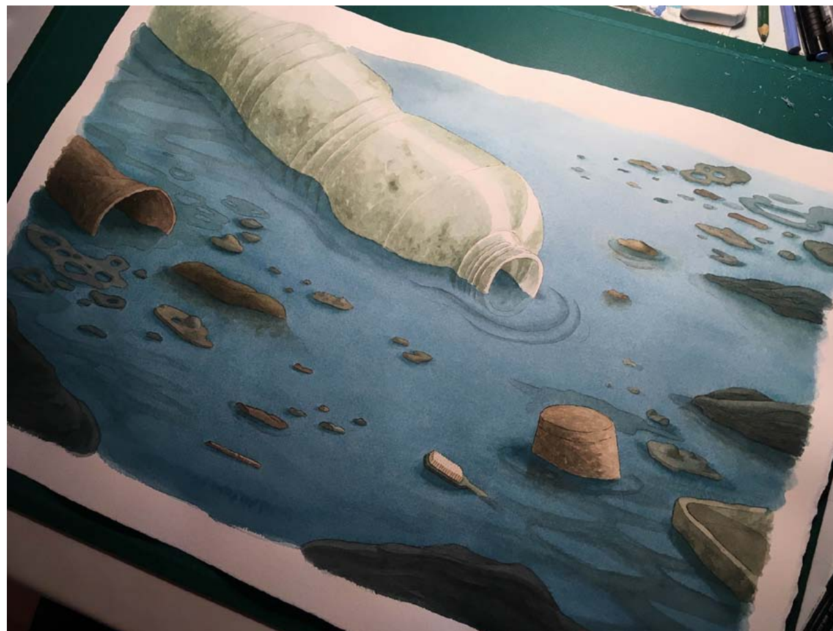
Ilustración de Xavier Salomó que retrata el mar de plásticos en el que sucede la historia.

“La literatura es esto, generar emoción, reflexión, experiencia”