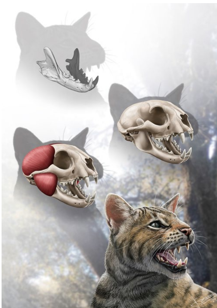
Reconstrucción del aspecto en vida de Magerifelis peignei dibujado por Jesús Gamarra.