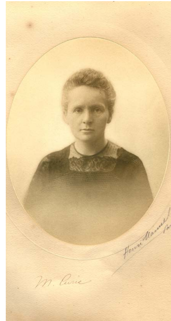
Fotografía de M. Curie con su autógrafo.