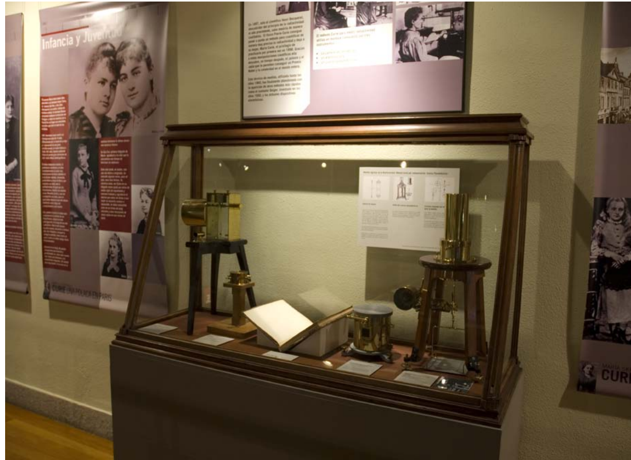
Instrumentos para la medición precisa de la radiactividad. En los extremos el espectroscopio (Izda.) y cuarzo piezoeléctrico, ambos prototipos de P. Curie.

El Instituto de Radiactividad funciona hasta 1940 y en 1979 se crea el Instituto de Geología del Museo Nacional de Ciencias Naturales que pasa a incorporar sus instrumentos. Por esta razón