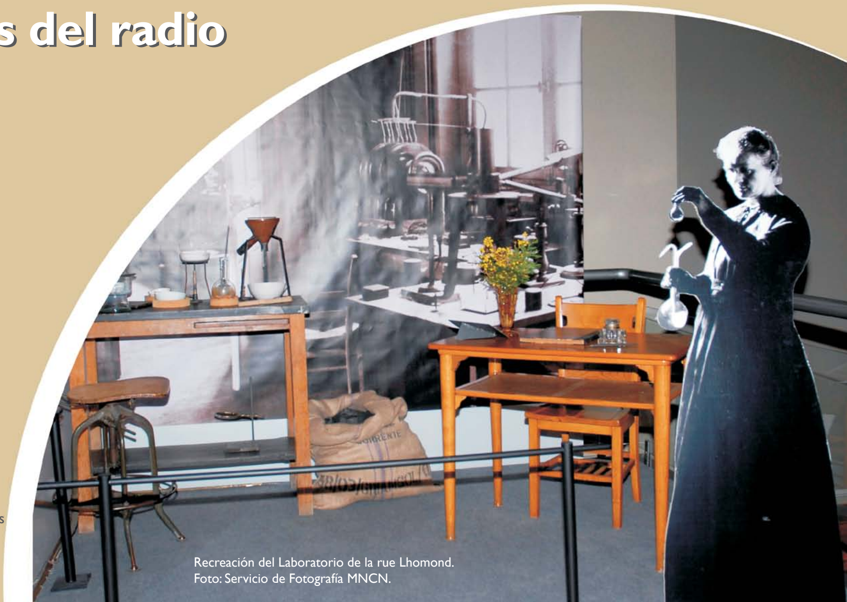
Recreación del Laboratorio de la rue Lhomond.