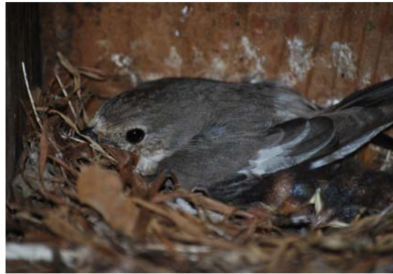
Papamoscas cerrojillo Ficedula hypoleuca

Dado que las cavidades de nidificación son un recurso escaso hay una fuerte competencia sobre ellas. Se encontró que los niveles de testosterona en hembras de papamoscas difieren entre poblaciones de la misma especie, siendo más elevados en poblaciones donde la probabilidad de usurpación de nidos por intrusos es mayor. Además, se encontró que el nivel de agresividad contra intrusos de hembras que criaron en zonas de alta densidad disminuye con altos niveles de testosterona. Tras la elección de un sitio de nidificación comienza la construcción del nido. Algunas especies como los trepadores mostraron patrones claros en selección de cajas nido y en la preferencia de ciertos materiales de nidificación. La selección del material de nidificación y la cantidad de barro que utilizan los trepadores puede explicarse como un compromiso entre la necesidad de su utilización y la