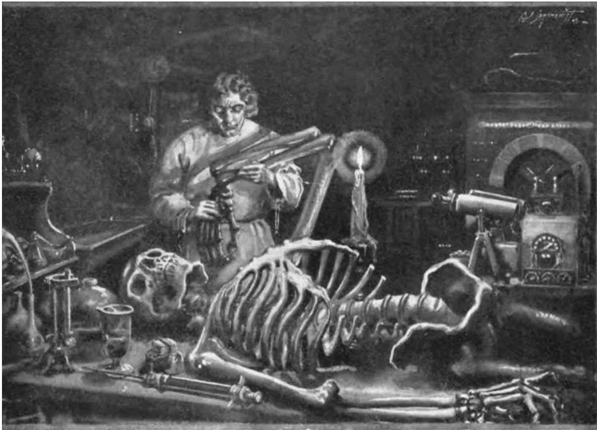
Frankenstein trabajando en su laboratorio

aparecer como opuestos). Conviene decir que, si entendiéramos de raíz el binomio emoción y raciocinio, se podría empezar a pensar en una IN (Inteligencia Natural) en contraposición a lo que eufónicamente se denomina IA (Inteligencia Artificial), de la cual los desarrollos actuales son una ridícula y potencialmente peligrosa caricatura de