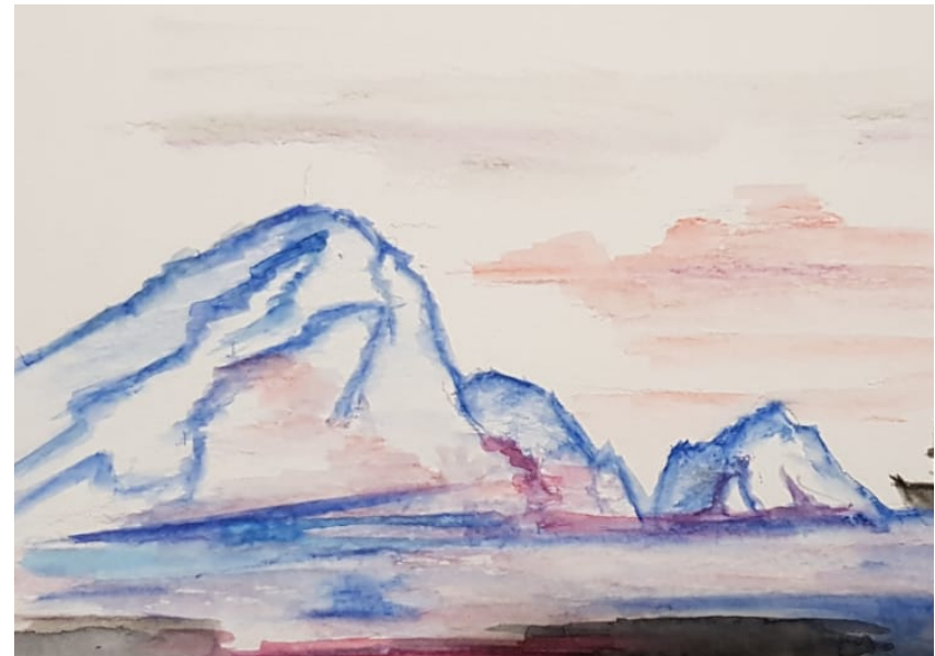
Acuarela 'Entre los hielos árticos' de M. Marin. La criatura desaparece en la oscuridad y la distancia de los hielos árticos

“Frankenstein está hoy más vivo que nunca en los desarrollos de la ciencia y sus implicaciones sociales, así como en toda la ignorancia e incertidumbre que todavía subsisten sobre muchos aspectos de nuestra naturaleza”