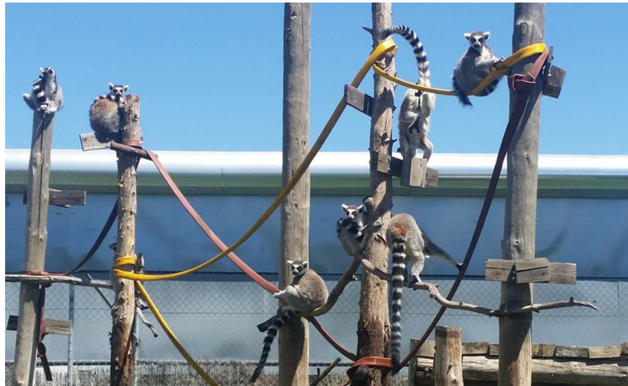
Un grupo de lémures de cola anillada, Lemur catta , en su área de recreo.