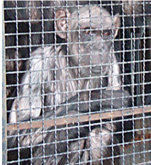
Chita, una chimpancé que llegó a Rainfer procedente de un circo pálida y encerrada en una jaula (izquierda). Hoy, 11 años después, su aspecto es muy diferente (Derecha)

La compraventa de primates es ilegal, salvo algunas excepciones, desde 1986 cuando España se adhirió al Convenio Internacional sobre el Tráfico de Especies Amenazadas (CITES). Sin embargo, son el tráfico de especies, la industria audiovisual, los circos, las mascotas abandonadas o los zoológicos, las procedencias de estos animales maltratados. Animales arrancados de su entorno por puro capricho porque, ¿qué se puede aportar a una persona mantener un animal fuera de su hábitat natural? A la persona no lo sabemos, al animal, mucho sufrimiento.