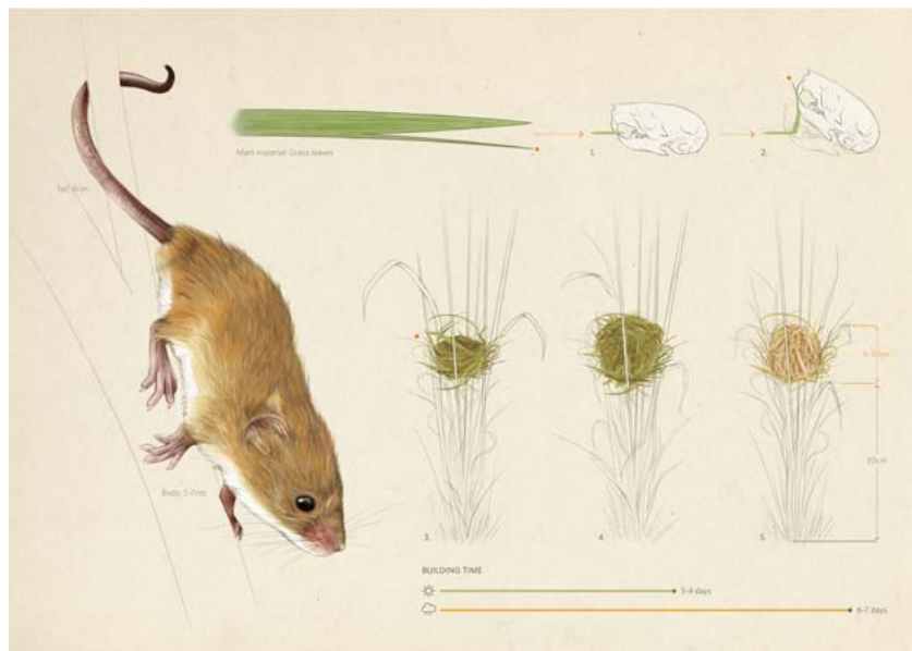
Micromys minutus . Construcción del nido para la el cuidado de su descendia / Clara Prieto

presentadas, colombianos, con 38 propuestas, rusos, con 34 obras, y mexicanos y argentinos, empatados con 28 propuestas.