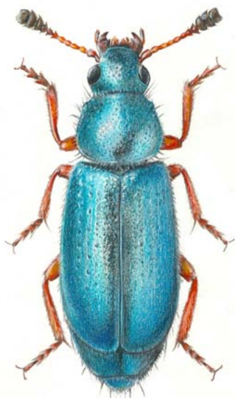
Necrobia Rufipes / Ana Calheiros da Cunha Duarte Soalheiro