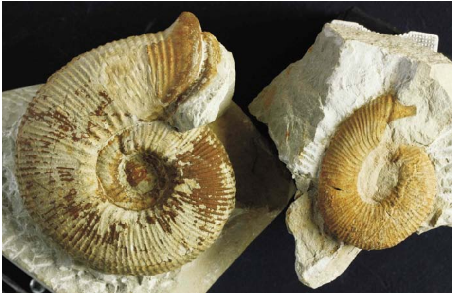
Ejemplo de pareja dimorfa: Olcostephanus (Jeannoticerias) jeannoti (d'Orbigny, 1841)

tólogos se dieron cuenta de que en los mismos niveles a veces había dos poblaciones de conchas adultas de tamaños diferentes mientras que las conchas infantiles eran muy similares entre si. Era al llegar a la etapa adulta cuando comenzaban a diferenciarse. Unas detenían antes el crecimiento, por lo que se les denominó microconchas, y a veces desarrollaban extensiones laterales que se denominan “orejillas” o “apófisis yugales”. Las otras alcanzaban mayores tamaños por lo que se les denominó macroconchas y solían tener una abertura más simple generalmente de forma sinuosa. Hoy en día se acepta que ambas conchas son el macho y la hembra de una misma especie. Aunque no está confirmado a qué sexo corres-