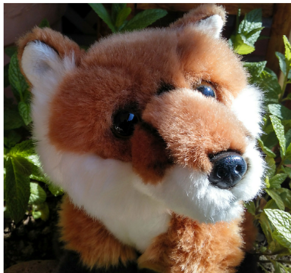
Este zorro es otra de las obras que cuelgan de los muros virtuales de la muestra. / Jesús Muñoz

en nuestra salvación, en el único vínculo entre el museo y su público, consiguiendo además que los trabajadores de museos nos replanteemos en qué proporción la planificación de nuestros proyectos expositivos debe incluir museografía física y al mismo tiempo oferta online .