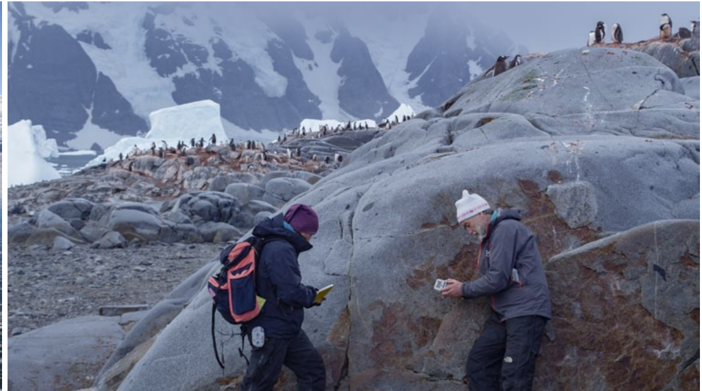
La fauna, el continente y la investigación protagonizan Antártida. Un mensaje de otro planeta

te lograría credibilidad para proyectos futuros.