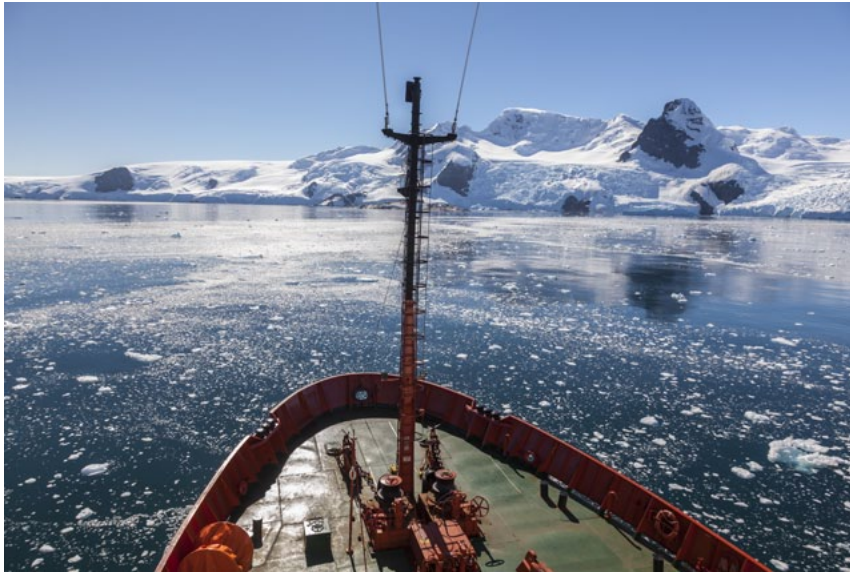
Navegando en el Hespérides por aguas antárticas