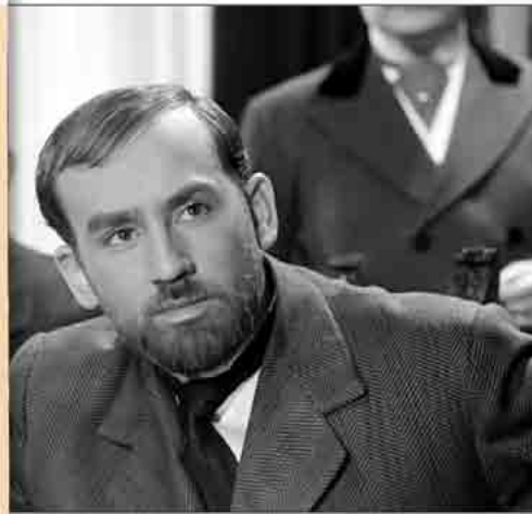
Con Salto a la gloria (León Klimovsky, 1952) el mito se populariza cuando llega al cine.