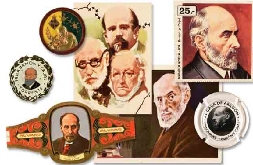
La imagen de Cajal que difundieron los gobiernos y los medios de comunicación tuvo su interpretación y retorno en la cultura popular.