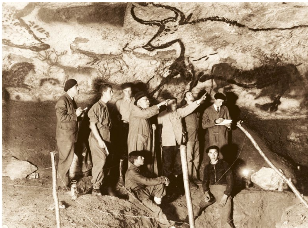
El arqueólogo francés Henri Breuil con sus colaboradores en la sala de los Toros de las Cuevas de Lascaux. Fue pintada durante el período Magdaleniense hace unos 18.000 años.

Los uros formaban parte de la megafauna del Pleistoceno. Fueron los antecesores del ganado bovino doméstico y del toro de lidia. Su población disminuyó de forma dramática después del Neolítico. El último ejemplar de esta especie fue una hembra que murió en Polonia en 1627. El Museo Nacional de Ciencias Naturales (MNCN-CSIC) exhibe los cuernos de un individuo encontrado en las Terrazas del Manzanares (Madrid). [Leer más]