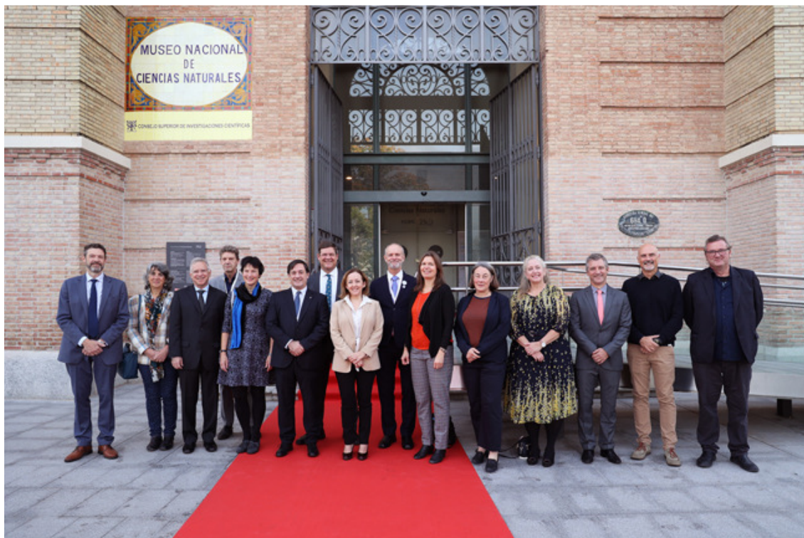
Foto de los asistentes al Foro internacional de directores de museos de historia natural.

y, por otro, mejorar la obtención de datos. El proyecto europeo DISSCO, que trabaja desarrollando una gran infraestructura científica que permita crear una colección accesible a todo el mundo, o el Earth BioGenome Project, centrado en la secuenciación del genoma de millones de especies, son iniciativas que caminan en esa dirección. Dos ejemplos del trabajo que, desde el mundo de las ciencias naturales, se está desarrollando para colaborar en las futuras estrategias de conservación. Y es que las colecciones de historia natural son una ventana al pasado, sí, pero también nos permiten prever el futuro.