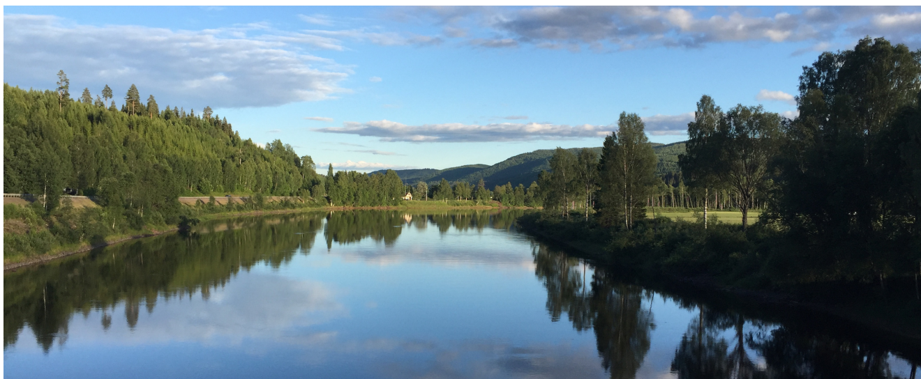
El río Klarälven en primavera. Imagen de Marit Kapla.

Tengo curiosidad por ver cómo evolucionan las cosas. Las condiciones de vida en las zonas rurales siguen siendo duras, y las escuelas, guarderías, farmacias y tiendas de alimentos luchan constantemente por sobrevivir. Me preocupa cómo esto continúa dividiendo a la nación. Sería mucho mejor si, por ejemplo, los beneficios de las turbinas eólicas beneficiaran más a las personas que viven en las zonas donde están situadas.