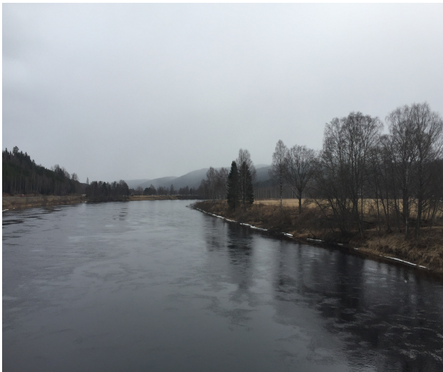
Fotografía del río Klarälven desde el puente que cruza Osebol.

Hoy en día, la mayoría de niños en Suecia crecen en una ciudad grande o pequeña, no en un pueblo. He vivido en Gotemburgo desde 1998 y mi familia abandonó Osebol en 2007, cuando mi padre se puso enfermo. Me di cuenta de que incluso yo me había convertido en uno de esos urbanitas que no tiene ni idea de lo que pasa en un pueblo como Osebol. Cada vez que leía en el periódico una noticia sobre el campo, parecía llena de prejuicios. No reflexioné acerca de lo interesante y rica que es la vida diaria en Osebol, y aquello me enfadó mucho y me motivó a escribir un libro sobre el pueblo.